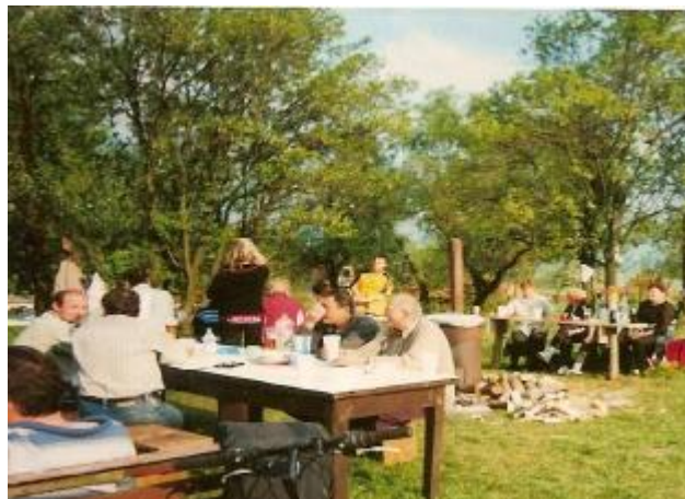
spoločné stretnutia na 1. mája