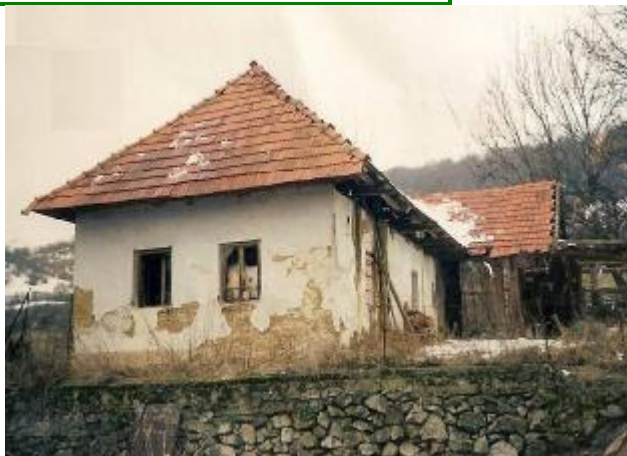
najstarší dom Ján Hagara - Lazovský