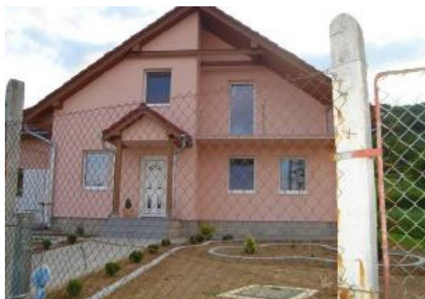
na okrajoch obce vyrastajú nové domy