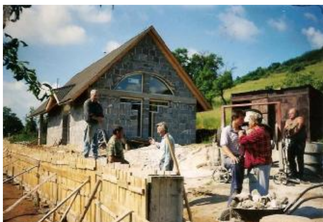
brigády na Dome smútku