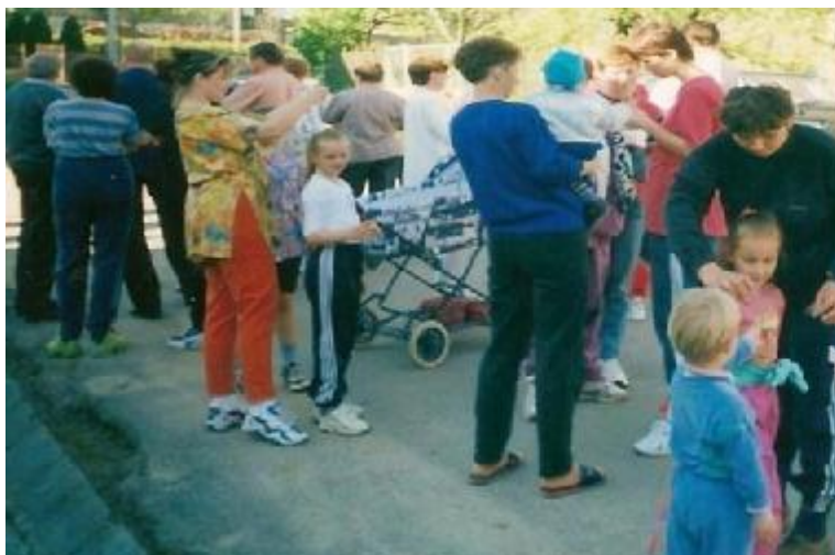
stavenie mája je vždy súčasťou života v tejto časti obce