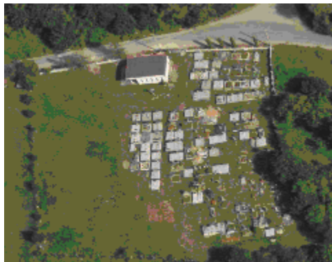
letecká snímka cintorína Mačov z vyššie menovanej www stránky

Či je alebo nie je váš nový hrob zakreslený v projekte, sa dozviete na stránke, kde sa nachádzajú letecké i popisné snímky všetkých našich cintorínov: www.cintoriny.3wsk.sk , v časti Diviaky nad Nitricou.